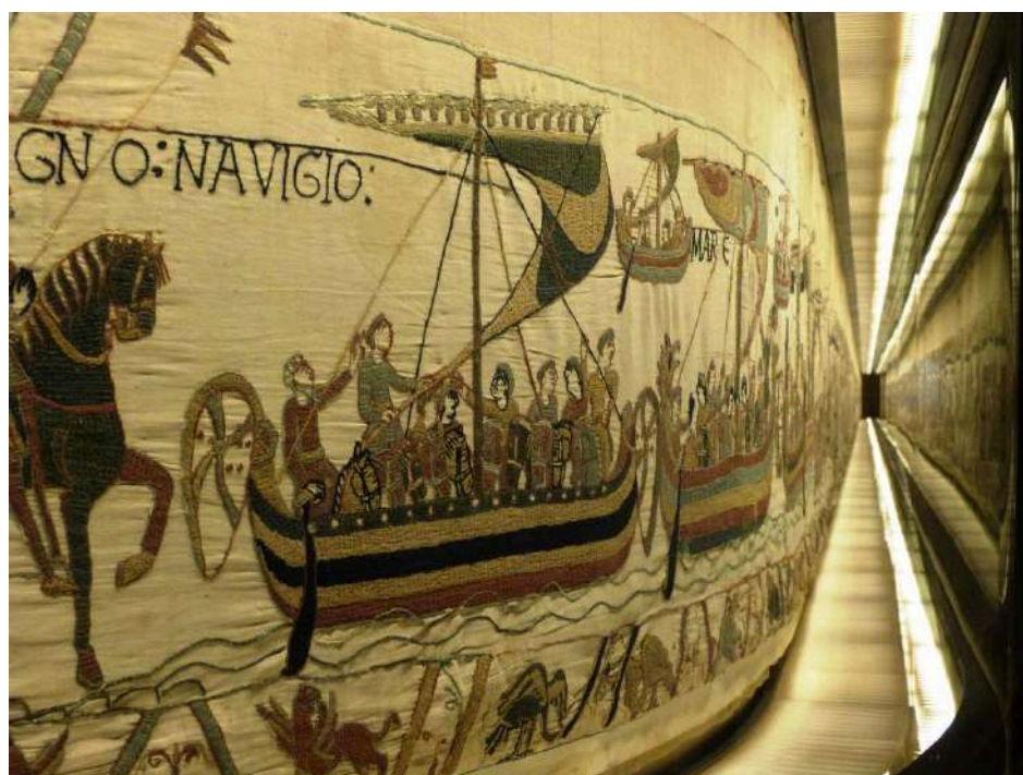
Le Musée d'Art et d'Histoire Baron Gérard